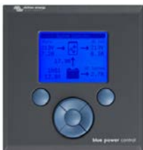
Tableau de contrôle Blue Power

Un solution pratique et bon marché pour une surveillance à distance, avec un bouton rotatif pour configurer les niveaux de Power Control et Power Assist.